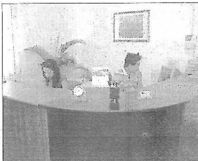
La P & P Investigazioni

Controllare la sicurezza della propria azienda, un modo pratico per cautelarsi da brutte sorprese, attuabile con l'aiuto di detective specializzati nel settore, come quelli della P & P Investigazioni di Tricase